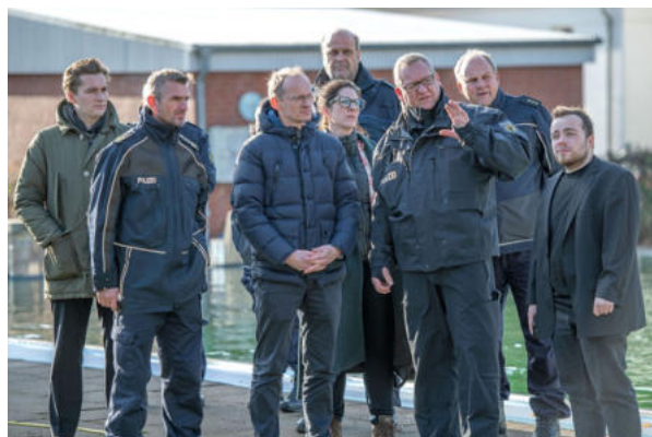
Bundespolizeiabteilung Ratzeburg

Im Büro selbst war meine Arbeit sehr vielseitig: Recherche, das Verfassen von Reden oder Impulsen für Veranstaltungen, Social Media, Pressemitteilungen, Bürgeranfragen oder die Vorbereitung von Terminen. Zu vielen dieser Termine durfte ich Henri dann auch begleiten – ob mit Unternehmen, Verbänden oder Stiftungen. So gewann ich einen direkten Eindruck davon, wie politischer Alltag wirklich aussieht. Auch parlamentarische Frühstücke und Abendveranstaltungen zu Themen wie Cybersicherheit, KI oder Sicherheitspolitik gehörten dazu. Zudem konnte ich Henri in den Ausschuss für Digitales und Staatsmodernisierung sowie in die AG Kommunalpolitik begleiten.