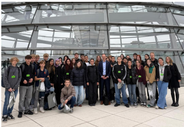
Besuch der 9. Jahrgangsstufe der Erich Kästner Gemeinschaftsschule im Bundestag

In den vergangenen Wochen durfte ich mehrere Gruppen aus meinem Wahlkreis in Berlin empfangen. Am 9. und 10. Oktober 2025 besuchten rund 50 ehrenamtlich Engagierte und politisch Interessierte aus dem Herzogtum Lauenburg und Stormarn-Süd die Bundeshauptstadt. Die zweitägige politische Informationsfahrt, die vom Presse- und Informationsamt der Bundesregierung organisiert wurde, bot einen spannenden Einblick in die Arbeit politischer Institutionen.