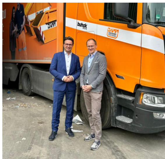
Austausch bei der Willi DAMM GmbH & Co. KG zu Kreislaufwirtschaft, Fachkräftemangel und Unternehmensentwicklung.