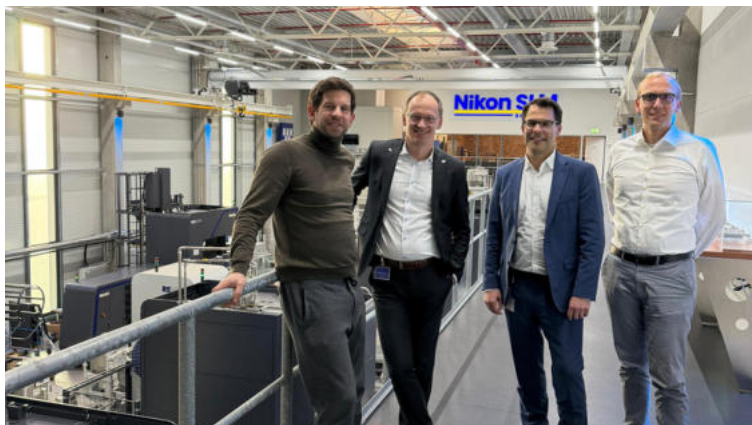
Besuch bei Nikon SLM Solutions mit Einblicken in moderne 3D-Metalldruck-Technologien.

Auch für meinen Wahlkreis nehme ich mir selbstverständlich weiterhin viel Zeit. Ich habe im Herbst wieder zahlreiche Unternehmen besucht, mich mit Bürgerinnen und Bürgern ausgetauscht und an verschiedenen Veranstaltungen im Herzogtum-Lauenburg und Stormarn-Süd teilgenommen.