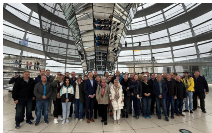
Politische Informationsfahrt des BPA mit Ehrenamtlichen aus dem Wahlkreis

Zusätzlich begrüßte ich rund 120 Schülerinnen und Schüler der 9. Jahrgangsstufe der Erich Kästner Gemeinschaftsschule Barsbüttel. Die Schülerinnen und Schüler hatten die Gelegenheit, eine Plenardebatte live zu erleben und sich danach mit mir über aktuelle politische Themen wie Wehrpflicht, soziale Gerechtigkeit und Außenpolitik auszutauschen. Es war beeindruckend, wie engagiert die Jugendlichen ihre Fragen stellten und Interesse an politischen Abläufen zeigten.