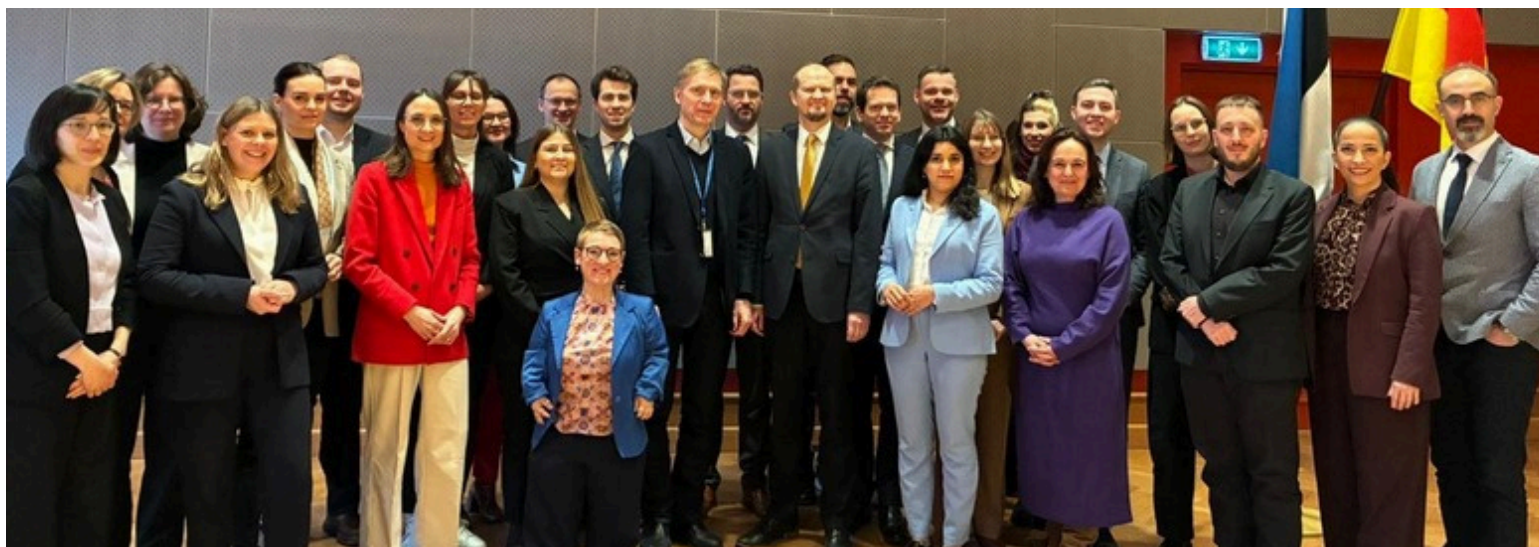
Teilnehmerinnen und Teilnehmer der Robert Bosch Stiftung beim Austausch in der estnischen Hauptstadt.

Für meine Arbeit im Deutschen Bundestag nehme ich wertvolle Impulse mit, insbesondere für die Weiterentwicklung unserer eigenen Staatsmodernisierung. Die Reise hat erneut verdeutlicht: Digitalisierung ist ein wichtiges Instrument, um staatliches Handeln effizienter zu gestalten.